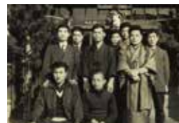
▲戦後入社した社員