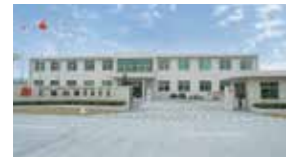
▲2003年上海白銅を設立

最初に、在庫不足が発生しており、お客様には多大なご迷惑をおかけしておりますことを深くお詫び申し上げます。仕入先様との連携を強化し、お客様に材料を安定的にお届けできるよう、在庫の拡充に努めてまいります。