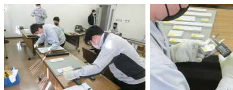
●静かな中にも闘志がみなぎる、真剣なまなざしの代表選手

自分の技能レベルと将来の課題を認識してもらう場として「全国製造技能選手権大会」を開催しています。大会を通して自分のスキルの改善点を見出し、より高い目標を目指す自己研鑽のよい機会となっています。また、社員の技術力アップが白銅の商品全体の品質レベルのアップに直結するだけでなく、全社的にも注目される大会です。今回は10月に各工場共通の課題「テストピース」の中、長さ計測し、計