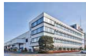
▲1988年神奈川工場完成