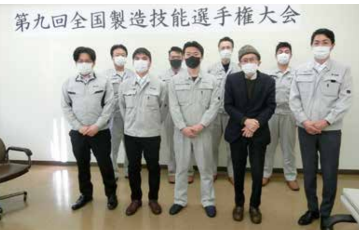
●各工場から選ばれ、本選に出場した代表者たち