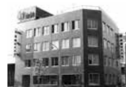
▲1967年完成の本社ビル