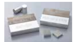
▲航空宇宙規格素材

国内におきましては、今後ますます白銅ネットサービスの進化に取り組むとともに、全社でJISQ9100の認証を取得し、航空宇宙産業に求められる品質マネジメント体制を整えてまいります。海外におきましては、これまでの上海をはじめとしたアジア以外にも展開を検討してまいります。