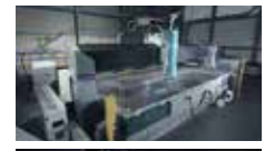
▲ウォータージェット(上)と金属3Dプリンターの最新機器(下)

フォーラスに真摯に向き合い、対策を講じてまいります。今後も皆様にご協力いただける活動に積極的に進めてまいりますので、変わらぬご支援を賜りますよう、切にお願い申し上げます。