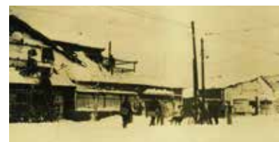
▲戦後からの八丁堀本社