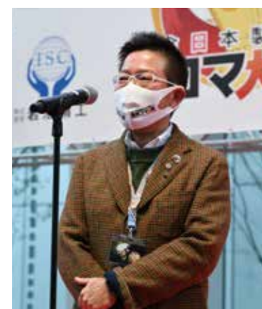
▲濱垣コマ大戦協会理事長の挨拶

は、新型コロナウイルスによる無期限延期ののち、各方面のご尽力の結果、12月開催に至りました。観戦は事前予約制で人数も制限されましたが、来場できなかった人のためにニコニコ動画公式チャンネルでの生放