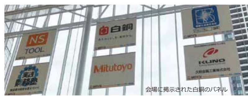
会場に掲示された白銅のパネル

ち抜いた各上位2チームと全国高校生コマ大戦の上位2チーム、海外から5チーム、さらに前回大会優勝チーム、前回世界コマ大戦の優勝チーム、ポイン