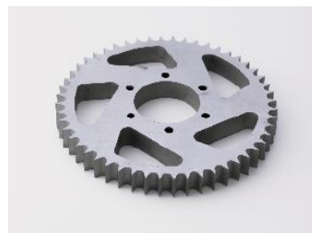
ウォータージェット加工品