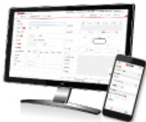
白銅ネットサービス