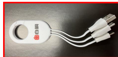
<カラビナマルチUSBケーブル>

LINE・Facebookのお友達登録で先着 100名様へ豪華ノベルティプレゼント！