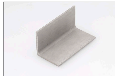
熱間圧延後熱処理酸洗仕上げ