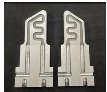
ハイブリッド造形による 三次元水管の入子