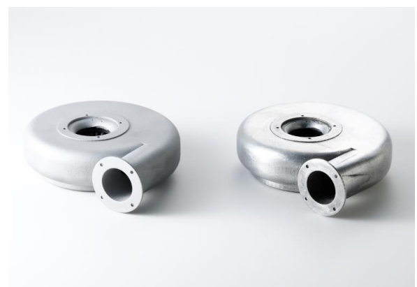
ショットブラストサンプル