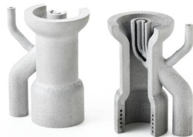
3D造形ならば実現可能な形状のサンプル