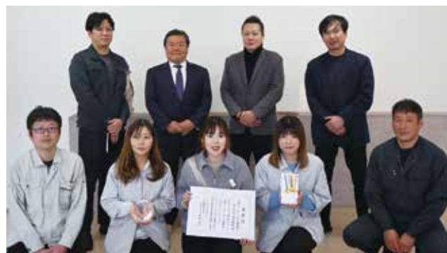
▲株式会社東信鋼鉄の社員の皆様と

グが即座に把握できるため、お客様の希望納期に対応可能か迅速に判断できる点は大きな強みです。締め切り間際でも注文ができ、注文履歴から配達予定納期を確認できるのも大変便利です。特に取消機能は秀逸で、電話連絡不要で修正できるので業務効率が向上しました。ミルシートや環境資料も即時取得でき、メーカー特定や資料削減にも役立つと思います。今後は環境資料のさらなる充実を期待しております。