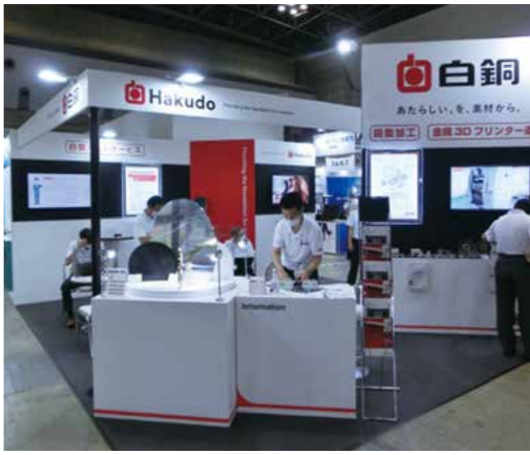
▲工夫を凝らしたディスプレイで白銅の商品・サービスを紹介

白銅は2022年6月22日(水)〜24日(金)の3日間、東京ビッグサイトで開催された「第27回機械要素技術展」に出展しました。コロナ禍で無人展示会となった2020年1月以来の久しぶりの出展となりました。展示ブースではYHスーパードアやeCosシリーズなどのオリジナル商品をはじめ