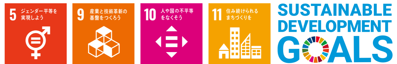
▲今回の分科会が目標とするゴールは上の4つです。