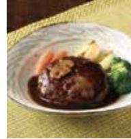
10,000 point ~ こだわりソースの煮込みハンバーグ