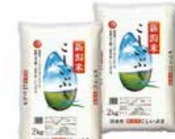
3,000 point ~ 新潟県産こしいぶき 2kg×2袋