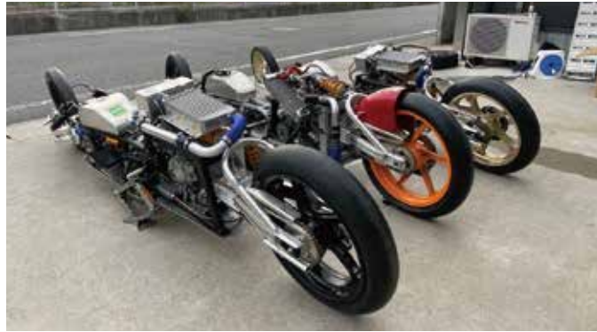
●世界最速を目指す3クラスのマシン

コロナ禍で苦闘する中 今回は新たな部門にも 挑戦する 前回のスーパーミニマム チャレンジでは、50cc +過給機と125cc +過 給機の2クラスで挑戦しま した。FIM(国際モーター サイクリズム連盟)と AMA(アメリカモーター サイクル協会)の2団体が あり、FIMでは1kmと 1.6km、AMAでは 1.6kmの距離で計測す るので、同時に3つの記録 が認定されます。前回は2 クラスで参加し、計6つの 世界最速記録を樹立できま した。今回はこの2クラス のマシンをブラッシュ アップして記録更新に挑む ほか、新たに100ccク ラスにもチャレンジする予 定です。80ccの2スト