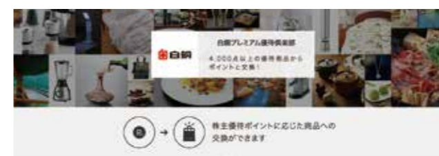
白銅プレミアム優待倶楽部のホームページ 4000点以上の商品から選択できます。

毎年9月末現在の当社株主名簿に記載または記録された300株以上保有の株主様が対象となります。対象の株主様には「白銅プレミアム優待倶楽部」のご案内を11月にお届けする予定です。登録手続きしていただいた株主様は保有株式数に応じたポイントにより、4000点以上の厳選された商品からお好みの商品を選択いただけます。一例として