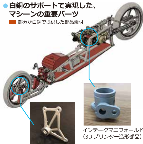
フロントフェンダーステー (3Dプリンター造形部品)