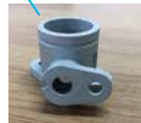
インタークマニフォルド (3Dプリンター造形部品)

白銅さんの3Dプリン ター造形部品を活用する ことで、大幅な軽量化を 実現、路面の追従性・安 定性が増し、コントロー ルしやすくなりました。 白銅さんの全面的な協力 は心強く、現場では大変 感謝しています。 コロナの影響で大会が 中止になった昨年、ソ ーバイクで日本縦断を しました。ボンネビルで の3クラス、4クラスで の世界最速を目指すこと はもちろん、ソーラーと 人間の力だけで世界一周 するという夢も加わりま した。来年還暦を迎えま すが、まだまだ世界をあつ と言わせない。それには 今後も白銅さんの協力が 不可欠です。 ※8月下旬開催予定のボン ネビル・モーターサイク ル・スピードトライアルは、 コロナ禍により時期が変更 される場合があります。