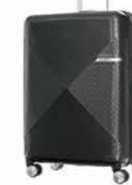
30,000 point ~ サムソナイト VOLANT SPINNER 68/25 EXP BLACK

と合算できる共通株主優待「コイン」『WILLS Coin』にも交換できます。また、社会貢献活動への寄付も可能です。 「白銅プレミアム優待倶楽部」は、日頃から白銅を支えてくださっている株主様との距離を縮める一歩です。今後も企業価値の向上、事業の拡大・発展に努めてまいりますので、引き続きご支援のほどよろしくお願いたします。