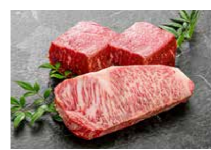
50,000 point ~ 米沢牛黄木

と合算できる共通株主優待「コイン」『WILLS Coin』にも交換できます。また、社会貢献活動への寄付も可能です。 「白銅プレミアム優待倶楽部」は、日頃から白銅を支えてくださっている株主様との距離を縮める一歩です。今後も企業価値の向上、事業の拡大・発展に努めてまいりますので、引き続きご支援のほどよろしくお願いたします。