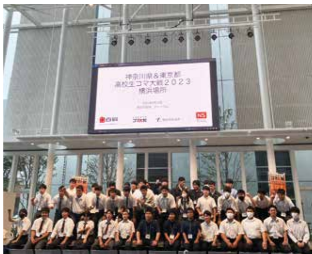
▲優勝を目指して参加した生徒たち 神奈川県 決勝トーナメント戦 優勝/神奈川県立小田原城北工業高等学校(初めての真鍮) 準優勝/神奈川県立小田原城北工業高等学校(新機械技術部を背負って立つものたち) 3位/神奈川県立神奈川工業高等学校(工士の攻め) 東京都 決勝トーナメント戦 優勝/東京都立多摩工科高等学校「ドリーさん」 準優勝/東京都立六郷工科高等学校「Team dual」 3位/東京都立六郷工科高等学校「コマFighter」 団体戦(神奈川 vs. 東京) 優勝/神奈川県 準優勝/東京都

「神奈川県&東京都高校生コマ大戦」が、2023年9月23日(土)横浜市役所1Fアトリウムで開催されました。例年のコマ大戦は神奈川県単独で行われておりますが、今年は東京都と合同開催になりました。新型コロナウイルスも落ち着き、ようやくいつもの学校生活に戻ってきて、生徒たちはより一層気合を込めて大会に挑んでいる様子でした。