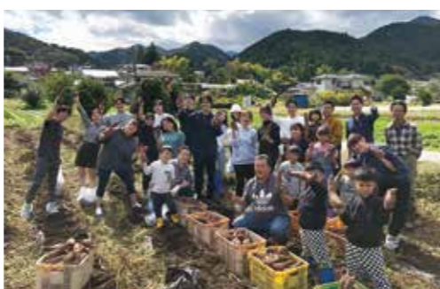
▲社員・家族みんなで芋掘り体験

福利厚生の一つとして、社内アンケート調査の結果、回答の多かった農業体験を行うことに決定。春に新入社員を中心として畑を耕し、さつまいもの植え付けを行い、10月22日(日)にみんなで収穫しました。従業員の子供も大勢参加し、「大きなさつまいもが掘れた！」と嬉しそうに見せるなど子供も大人も和気あいあいと芋掘りを楽しみました。