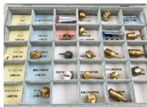
▲創意工夫を凝らしたユニークなコマも！

今年も多種多様なコマが勢揃いし、王道コマとイボ型コマの息詰まる熱戦が繰り広げられました。あまりの悔しさに頭を抱え込みながらひざまずく生徒もいて、生徒たちのコマ大戦に対する熱意や真剣さが伝わってきました。なお、本大会は白銅が協賛し、「コマ」の材料も提供しています。