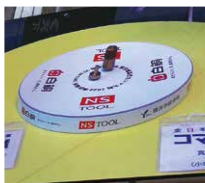
▲ユニークなコマが激突する大熱戦！