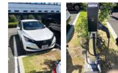
▲厚木営業所に納められたEV車 ▲充電設備