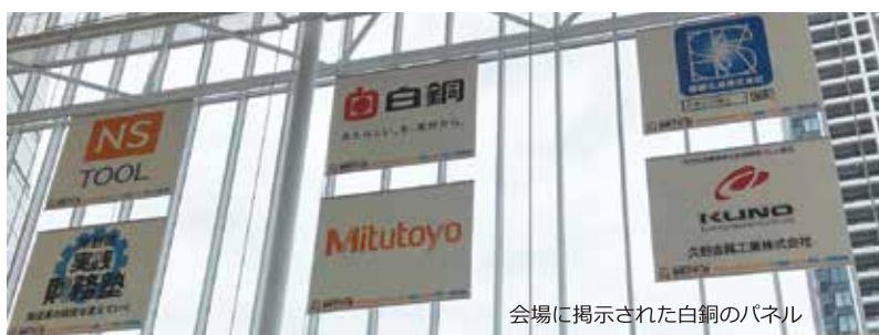
会場に掲示された白銅のパネル

ち抜いた各上位2チームと全国高校生コマ大戦の上位2チーム、海外から5チーム、さらに前全国大会優勝チーム、前回世界コマ大戦の優勝チーム、ポイン