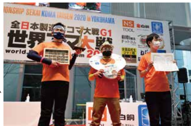
▶優勝チーム「こましん」