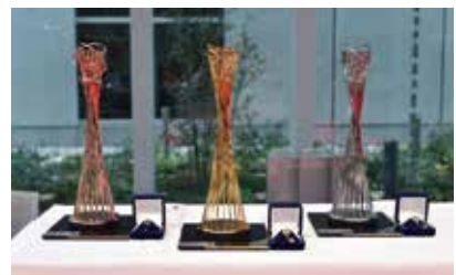
▲入賞チームに贈られるトロフィーと記念メダル