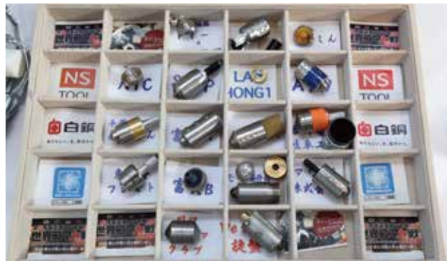
▼参加チームの使用コマ