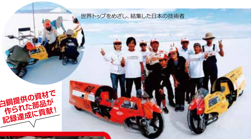
世界トップをめざし、結集した日本の技術者