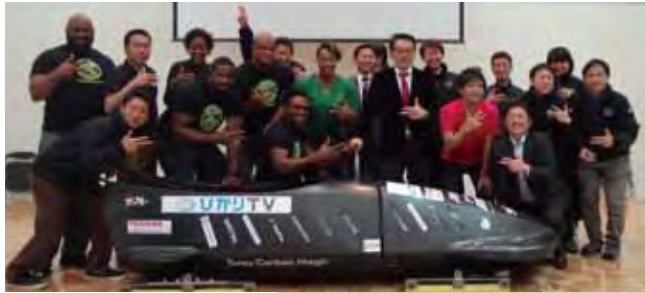
ジャマイカが下町ボブスレー採用を決定! オリンピックを目指し、協力を誓う選手と開発チーム。

大田区のものづくり集団が世界に挑戦! 下町ボブスレー、冬季オリンピックを目指す。知っていると、ちょっと役立つ! ~豆知識~「白銅ネットサービスの便利機能ご紹介」/「お客様の声」「私と白銅」富源商事株式会社 / 白銅新商品・新サービスのご紹介「図面加工対応のご案内」白銅からのお知らせ / 編集後記